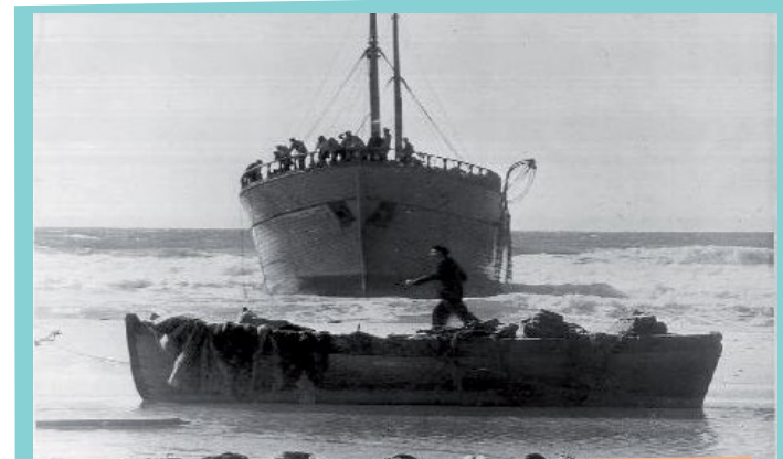
אניית המעפילים סוזנה- 1947

מבצע העליה האחרון לישראל היה בשנת 2022 בזמן המלחמה באוקראינה, והוא קיבל את השם "חוזרים הביתה", במבצע הזה העלו את יהודי אוקראינה רוסיה ובלרוס לישראל.