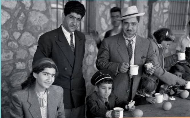
IMG wikipedia-NiLi : עולים יהודים מעירק- ארכיון בנו רוזנברג 1951 Benno Rothenberg /Meitar Collection / National Library of Israel The Pritzker Family National Photography Collection / CC BY 4.0

גם אחרי שהוקמה מדינת ישראל, המשיכו יהודים לעלות מכל רחבי העולם, והיו אפילו כמה מבצעים מיוחדים ונועזים של ממשלת ישראל להעלות יהודים ממדינות עוינות.