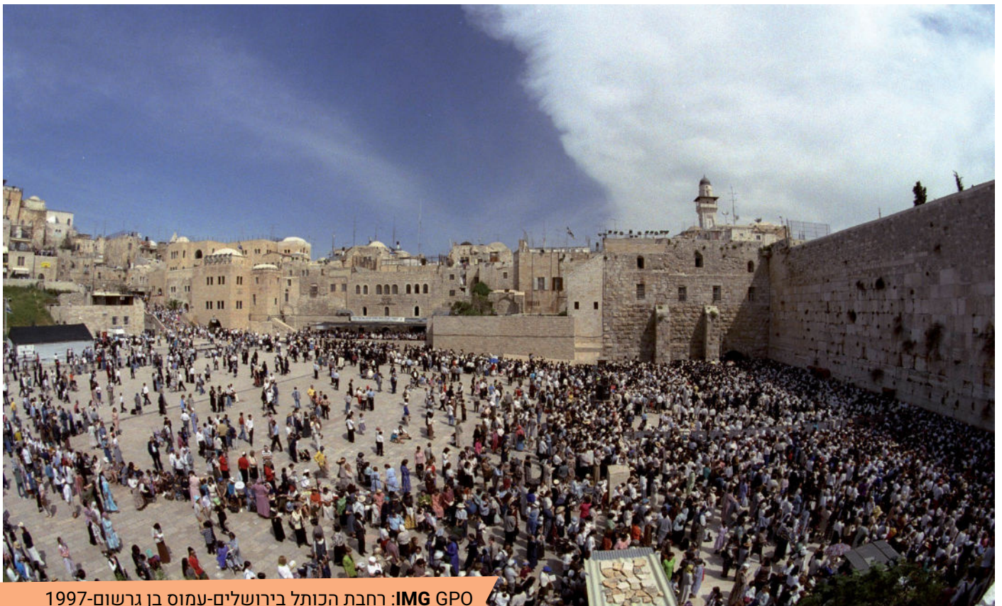
רחבת הכותל בירושלים-1997

ובגלל שירושלים קדושה יותר מכל המקומות בעולם, אנו משתמשים במושג "לעלות לירושלים" ולכן, מי שעלה לירושלים בשלושת הרגלים, נקרא "עולה רגל".