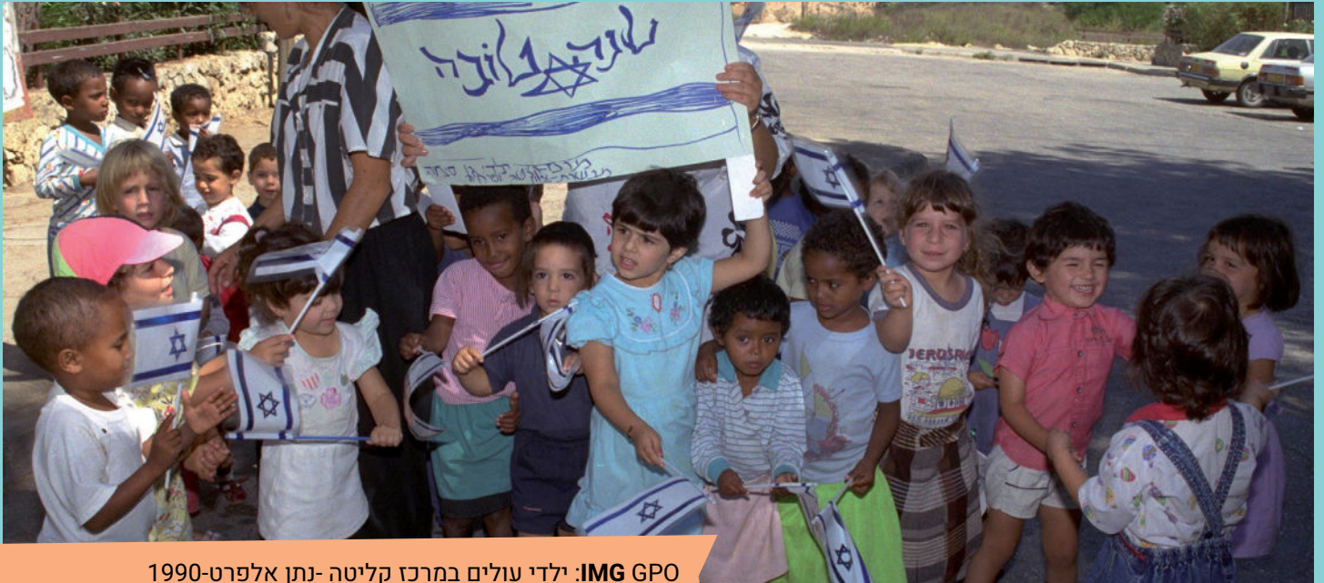
IMG GPO: ילדי עולים במרכז קליטה-נתן אלפרט-1990

לצייר ציור עם צבע אחד יכול להיות דבר מאוד יפה.