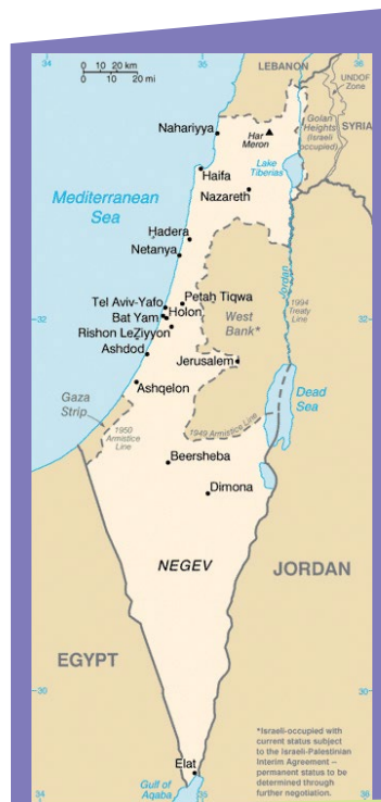
IMG WIKIPEDIA .Israel's borders in 1948

גם בגבול הצפוני אין שקט לישראל וגם שם ישנו כח צבאי גדול שמגן על תושבי הצפון וכל ישראל מאוייבנו שבלבנון.