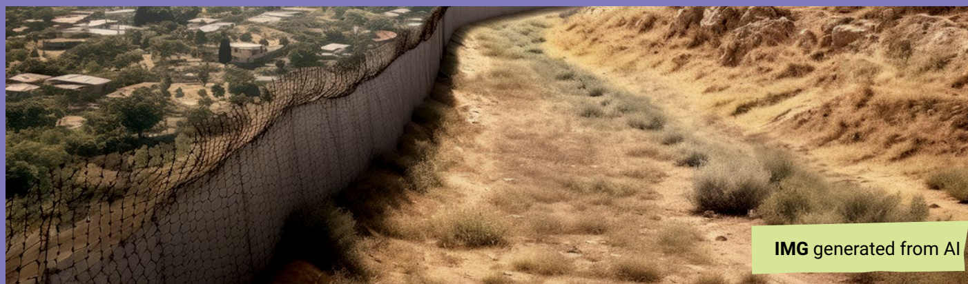
IMG generated from AI

והאם ידעתם גם, שאם תשוטו לכם להנאתכם בים המלח (רק תזהרו, המים ממש ממש מלוחים) באיזשהו שלב תעברו מישראל לירדן, אפילו שאין באמצע שום דבר פיזי שמעיד על כך, אבל שם עובר חלק מהגבול בין ישראל וירדן.