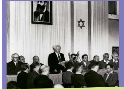
Ben-Gurion declared the independence of the State of Israel on May 14 th 1948

שאלת הגבולות של מדינת ישראל מלווה את ישראל לאורך כל שנותיה, והיא אתגר לא קטן ביחסים בינה לבין הפלשתינים, וגם עם המדינות השכנות.