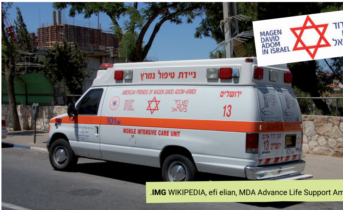
.IMG WIKIPEDIA, efi elian, MDA Advance Life Support Ambulance

בטח שמעתם על ארגונים כמו מגן דוד אדום או איחוד הצלה, שנותנים סיוע בעזרה ראשונה דחופה. במקומות אלו מתנדבים אנשים שעוברים הכשרה מיוחדת, ובעצם הופכים לנותני עזרה ראשונה מורשים.